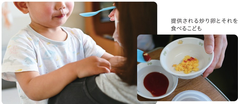
提供される炒り卵とそれを食べるこども

小児科では、主に食物アレルギー、気管支喘息、アトピー性皮膚炎、アレルギー性鼻炎を診療しています。アレルギー疾患は慢性疾患であり、長期間の治療管理を要する場合があります。