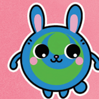
PL病院キャラクター コロン